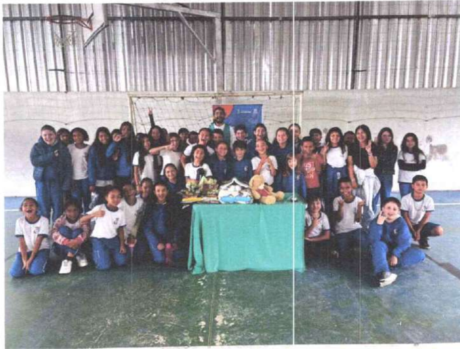
EMEB Osvaldo Ludovico Fuckner – 04/06/2025

Observatório SOCIAL DO BRASIL BRUSQUE | SC